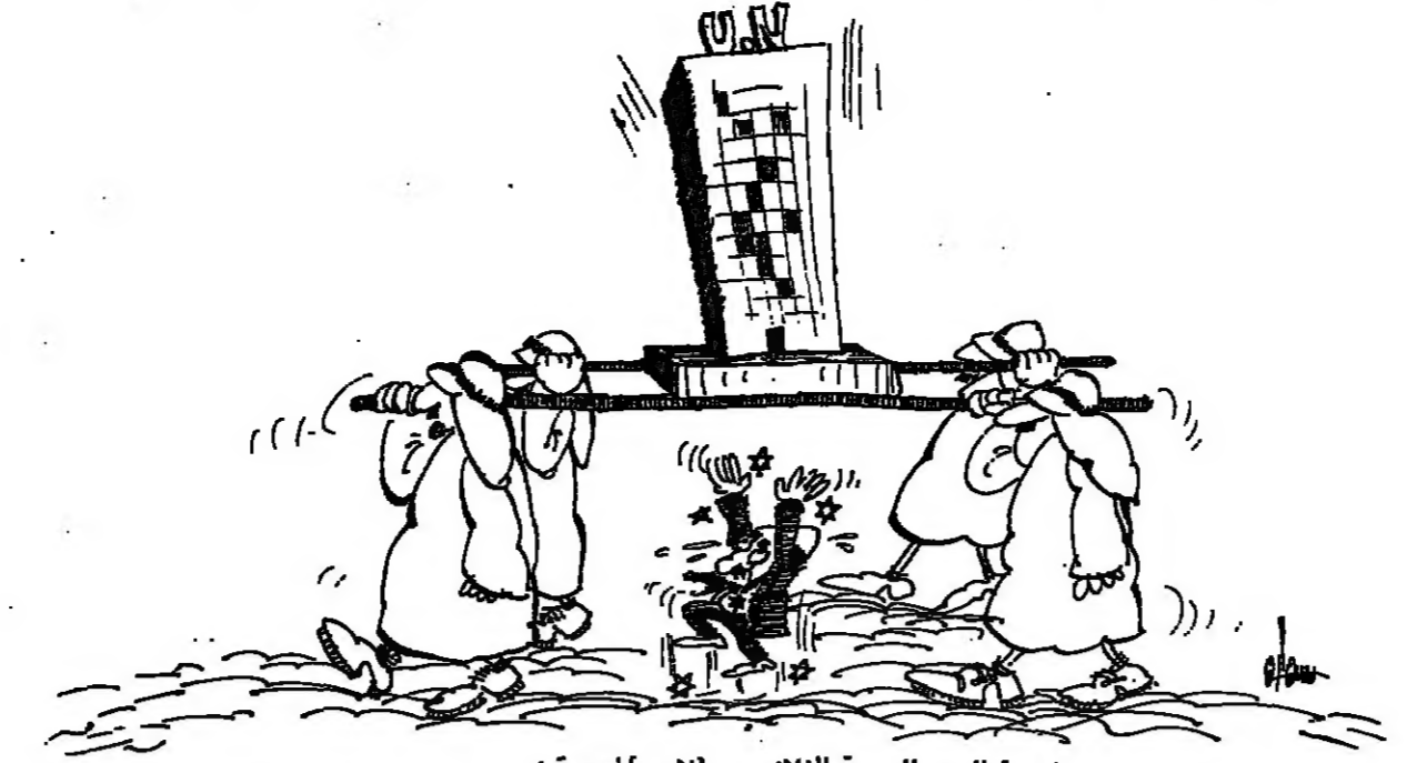
( تبدأ اليوم الدورة الثلاثون ، للأمم المتحدة )

لماذا نريد ؟ بل ماذا نعني بالتمام والكمال ؟ ما ننيه - وبالتمام والكمال - ان اجازير التي ترتك تارة باسم الحفاظ على الديمقراطية ، وتارة اخرى باسم تعديل النظام ، وتطور الخياط باسم تعديل النظام . وتطور الخياط باسم تعديل النظام .